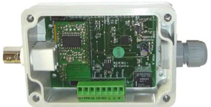
Boîtier DBR12 (vue interne)