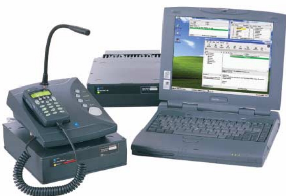
Logiciel Email pour HF UUPlus avec l'équipement HF Codan

La sélection de canaux est automatisée en pré-configurant jusqu'à 5 canaux dans le logiciel UUPlus, ou en utilisant la fonctionnalité Gestion automatique de liaison (CALM) Codan de l'émetteur-récepteur.